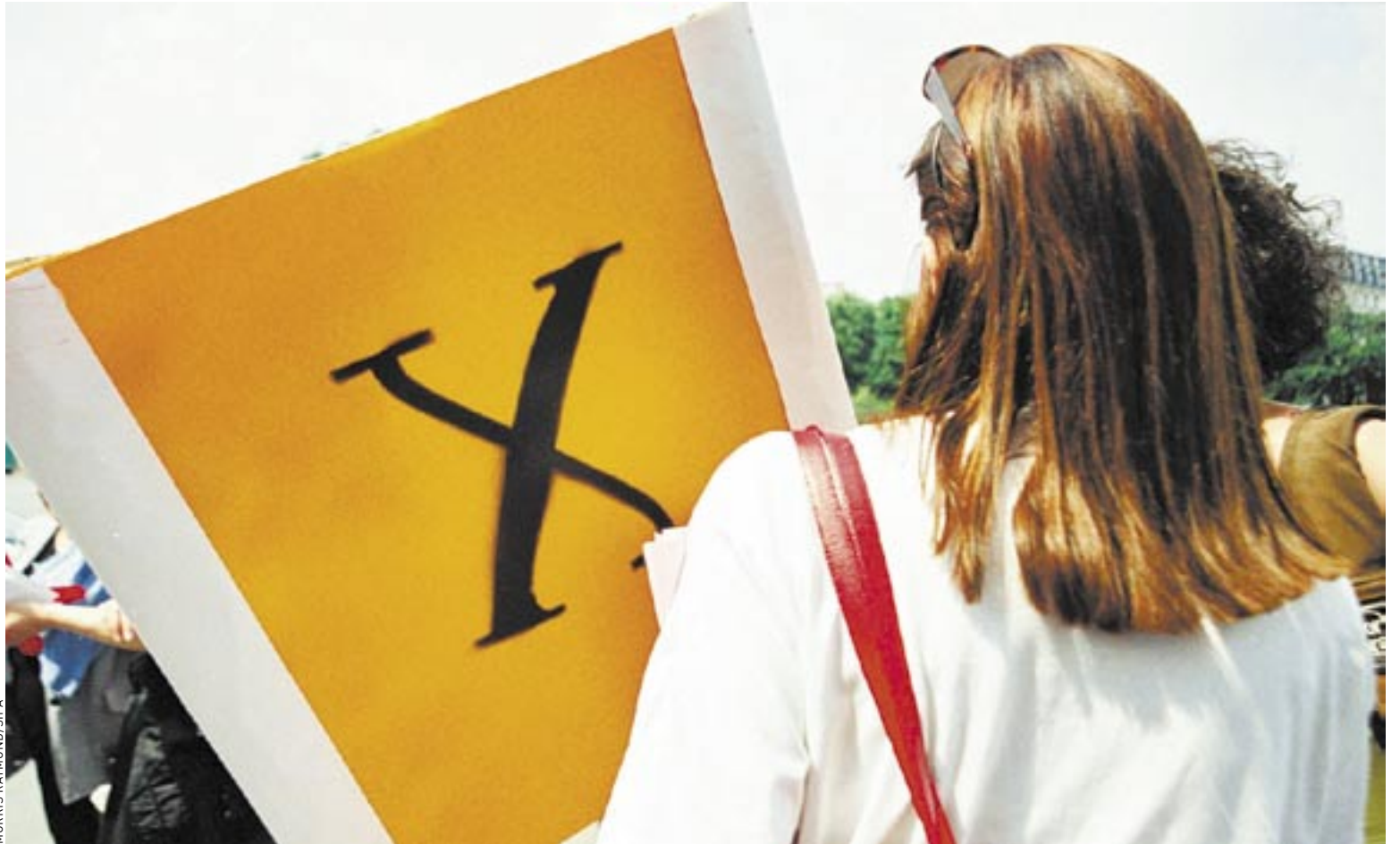
Manifestation de personnes nées sous X, en 2001. En 2002, le législateur a encadré l'accès aux origines personnelles des enfants abandonnés.